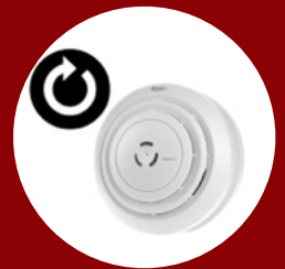
Sicherheit durch Selbsttest