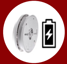
Autark durch Batteriebetrieb