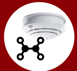
Anschließbar an Geräte der SatMOS® Familie