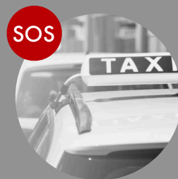
Sicherheit für Taxi-Fahrer